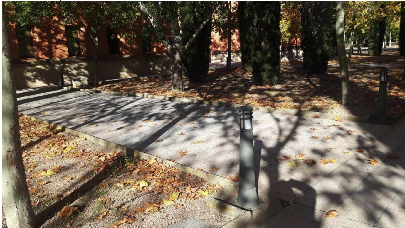
Ejemplo de Acerados y bordillos a eliminar para la creación de una pradera sostenible agregando parterres.