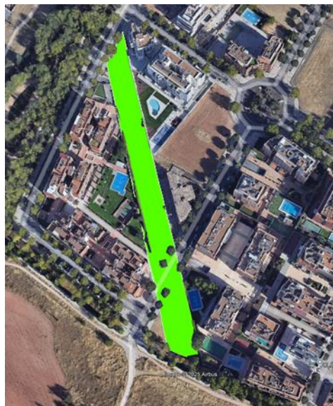
Eje arbolado Ronda Sur – Vía Verde

Mapas, fotografías y otros elementos gráficos que muestren la ubicación y estado actual de las zonas en las que se va a actuar, detalle de las intervenciones propuestas (planos tipo, secciones, etc.), o cuanta información gráfica se considere esencial para comprender la actuación (las imágenes tendrán una resolución tal que el archivo completo de Ficha Acciones B no supere los 20 MB).