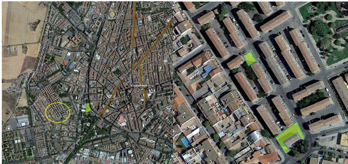
Localización de las zonas a renaturalizar de Pío XII.