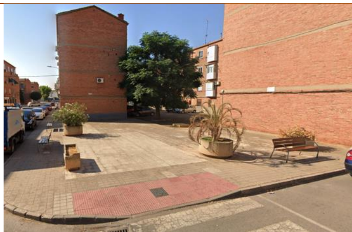
Estado actual de la zona de Pio XII.