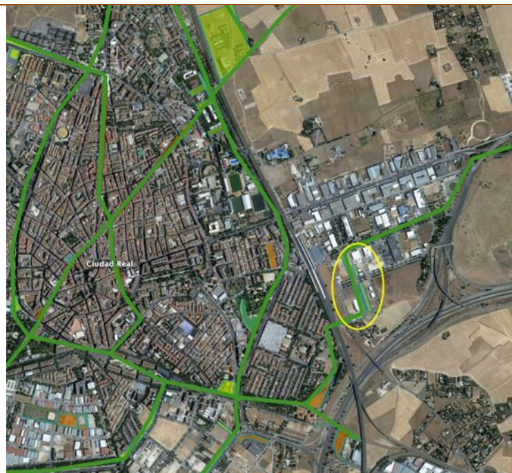
Zona de la actuación dentro de los ejes verdes.