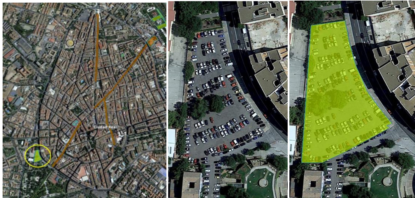
Zona de aparcamiento a renaturalizar, adyacente al parque de Gasset (sur), a la ZBE (este) y a un centro escolar (oeste).

Mapas, fotografías y otros elementos gráficos que muestren la ubicación y estado actual de las zonas en las que se va a actuar, detalle de las intervenciones propuestas (planos tipo, secciones, etc.), o cuanta información gráfica se considere esencial para comprender la actuación (las imágenes tendrán una resolución tal que el archivo completo de Ficha Acciones B no supere los 20 MB).